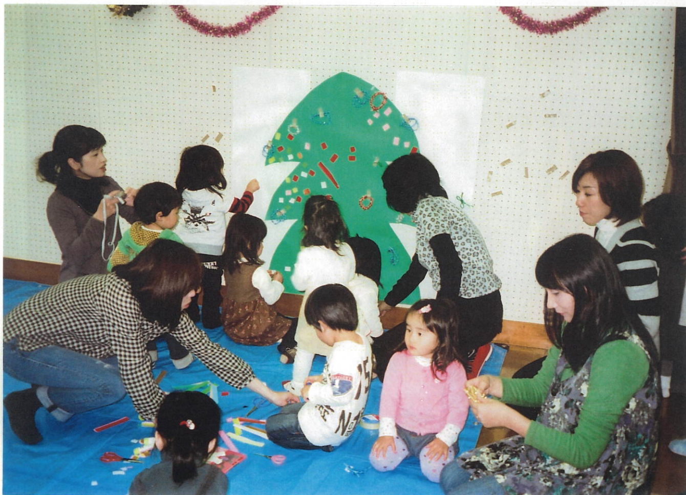
クリスマス・もみの木に飾り付けをしました